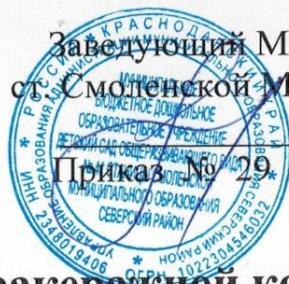
График работы членов бракеражной комиссии по питанию